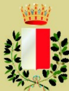
Comune di Bari